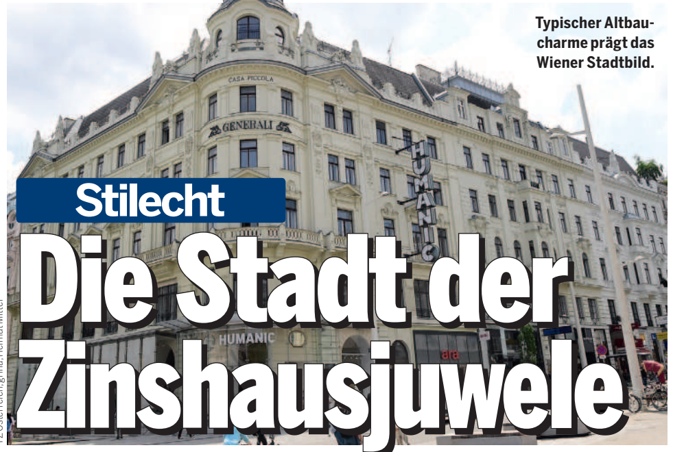
Typischer Altbaucharme prägt das Wiener Stadtbild.